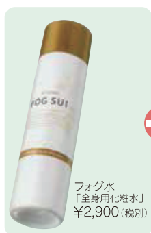
フォグ水 「全身化粧水」 ¥2,900 (税別)