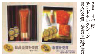
2014年度 モンドセレクション 最高金賞・金賞連続受賞