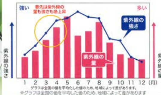
[年間の紫外線量と強さ]

紫外線の強さは、6月頃が最も強く、12月には弱くなります。しかし、夏にだけ紫外線対策を行っても、安全に肌トラブルを防ぐことはできません。その理由は紫外線の「量」にあります。年間紫外線量の約7~9月の間に降り注いでおり、これが春先に肌トラブルが起こりやすくなる原因の一つだと言われてます。紫外線対策を怠りがちな季節に、知らず知らずのうちにダメージが進んでしまうのです。