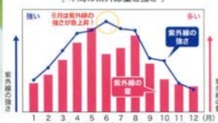
【年間の紫外線量と強さ】

紫外線は、6月頃が最も強く、12月には弱くなります。紫外線対策を怠りがちな夏前の季節に、知らず知らずのうちにダメージが進んでしまうのです。だから、夏にだけ紫外線対策を行っても、安全に肌トラブルを防ぐことはできません。また、年間紫外線量の多くは4~9月の間に降り注いでおり、これが肌トラブルを起こす原因の一つだと言われています。