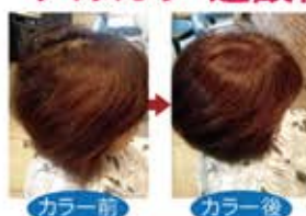
カラー前 カラー後

アフロイアシリーズはパーマ・カラーをしながら、同時に残留アルカリや残留過酸化水素を除去し、ダメージを修復する画期的な新技術です。