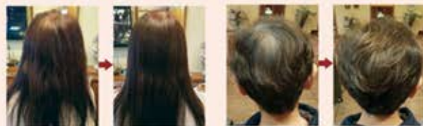
使用前 バック1回使用後 使用前 バック1回使用後